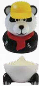
D8 • PAN DAN Gelato al gusto vaniglia € 5.00