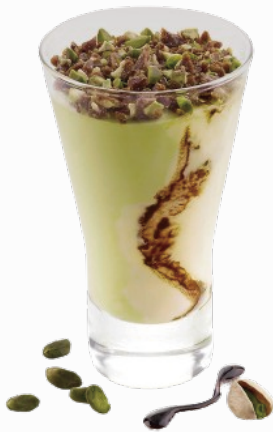
D10 • COPPA CREMA E PISTACCHIO Coppa gelato alla crema e al pistacchio variegato al cioccolato, decorata con pistacchi pralinati € 6.00