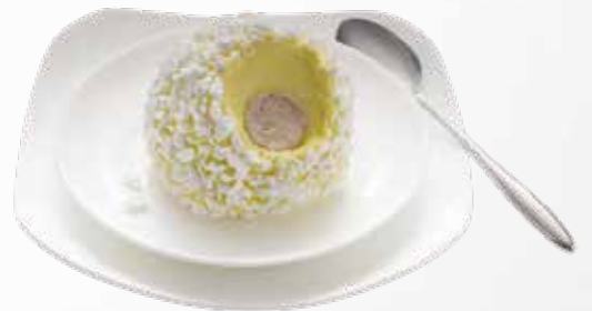
D12 • TARTUFO BIANCO Gelato semifreddo allo zabaione con cuore di gelato al caffè decorato con granella di meringa € 6.00