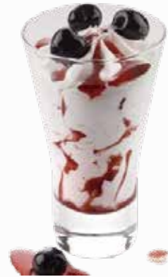
D11 • COPPA SPAGNOLA Coppa gelato alla panna variegato al amarena e decorata con ciliegie amarenate. € 6.00