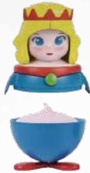
D7 • PRINCIPESSA Gelato alla fragola € 5.00