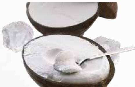
D9 • COCCO RIPIENO Noce di cocco ripiena con gelato al cocco € 6.00